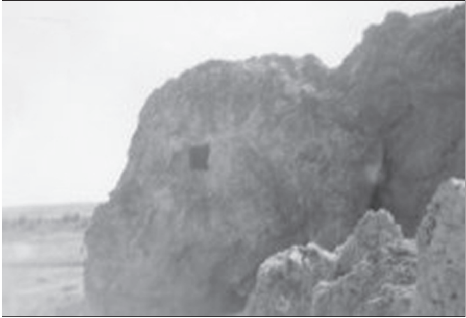
Rijnayîşî ra ver Kerrey Isporî

dest ra yeno çîyo weş virazeno û cayo bîn de zî însan şono rehet-rehet rijneno.