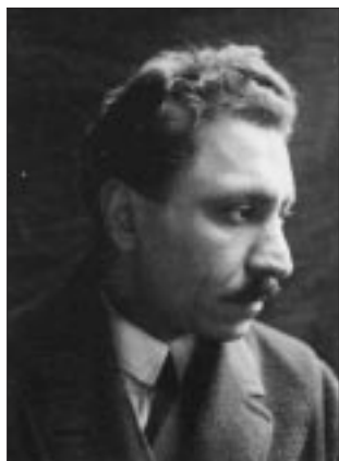
Celadet Alî BEDIRXAN