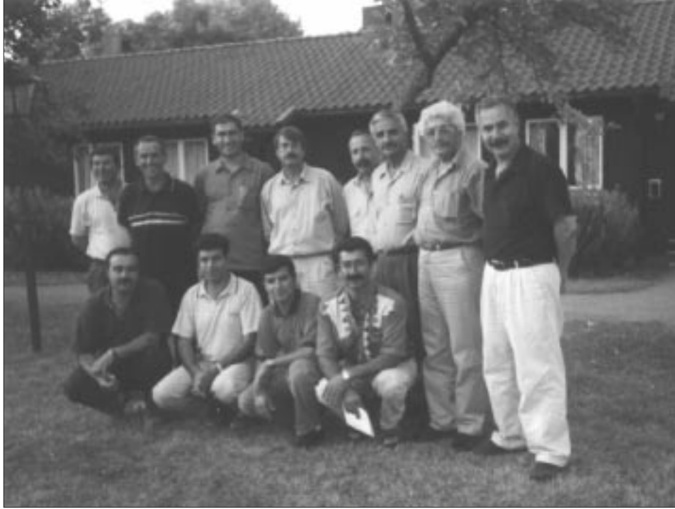
Kombîyayîşê Kirmanckî yê şeşine ra yew grube