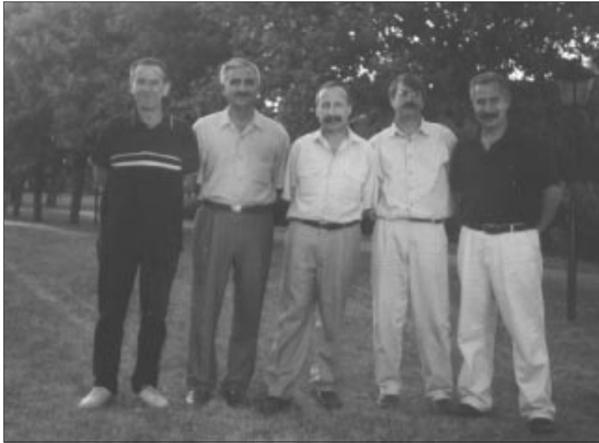
Kombîyayîşê Kirmanckî yê şeşine ra yew grube