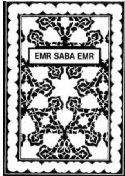
41) Emr Saba Emr, çarnayox: Durmaz GBV, Dillenburg, 14 r.