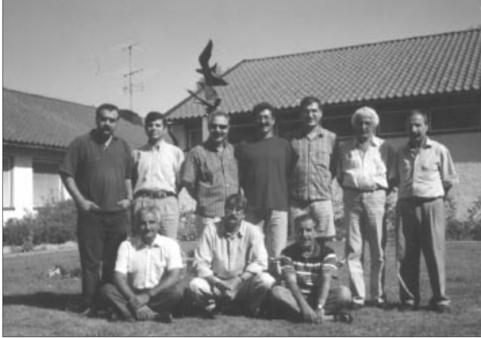
Kombîyayîşê Kirmanckî yê şêşine ra yew grube